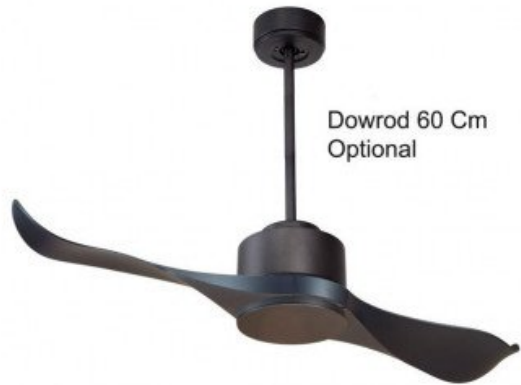
Dowrod 60 Cm Optional