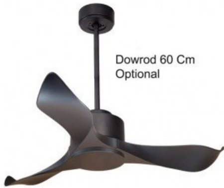
Dowrod 60 Cm Optional