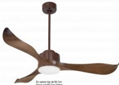
En option tje de 60 Cm Down roof 60 Cm Option Disponibile extensi3n 60 cm