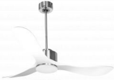
En option tige de 60 Cm Down rod 60 Cm Option Disponible extension 90 cm