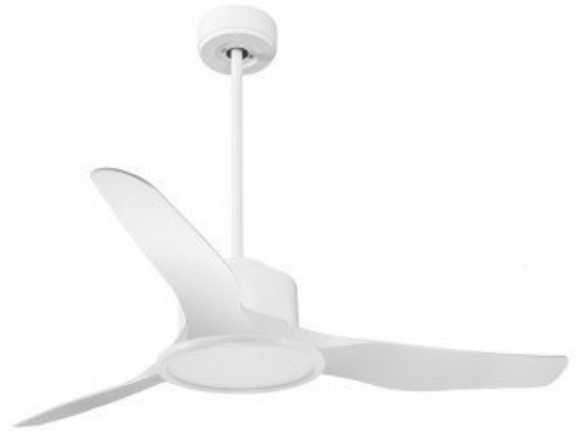
En option tije de 60 Cm Down rod 60 Cm Option