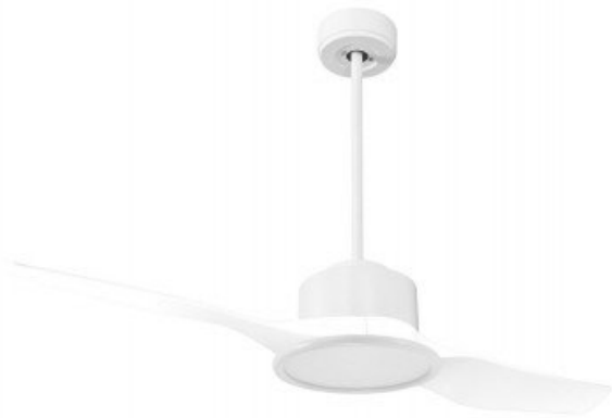
En option tije de 60 Cm Down rod 60 Cm Option