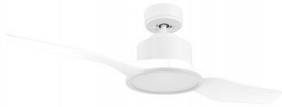
En option tije de 60 Cm Down rad 60 Cm Option