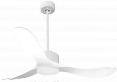
En option tje de 60 Cm Down rod 60 Cm Option Disponibile extention 60 cm