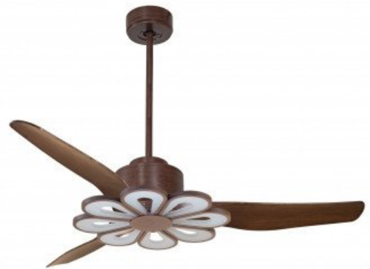
En option tige de 60 Cm Down rod 60 Cm Option