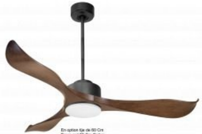
En option tige de 60 Cm Down rod 60 Cm Option Disponibile exteriore 60 cm