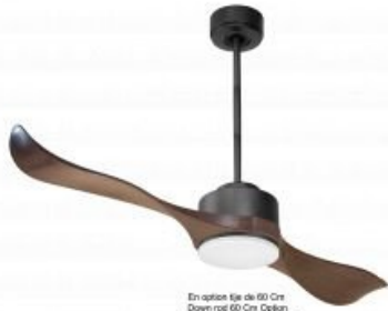
En option tige de 60 Cm Down rod 60 Cm Option Disponibile exteriore 60 cm