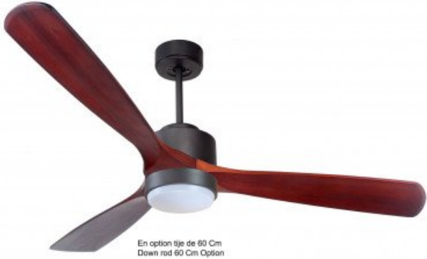
En option tije de 60 Cm Down rod 60 Cm Option