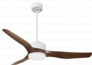
En option tje de 60 Cm Down roof 60 Cm Option Disponibile extensi3n 60 cm