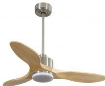
En option tije de 60 Cm Down rod 60 Cm Option