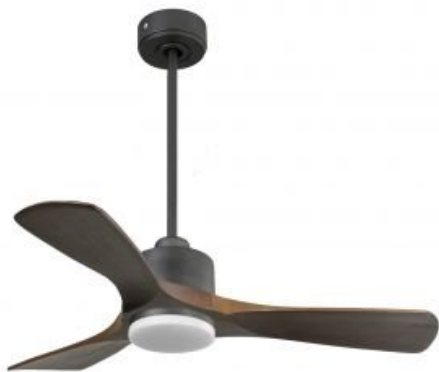
En option tije de 60 Cm Down rod 60 Cm Option.