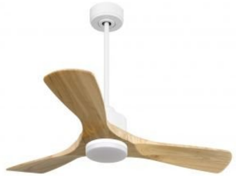
En option tije de 60 Cm Down rod 60 Cm Option