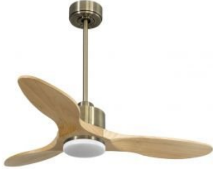
En option tije de 60 Cm Down rod 60 Cm Option