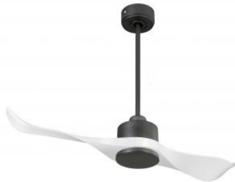
En option tige de 60 Cm Down rod 60 Cm Option