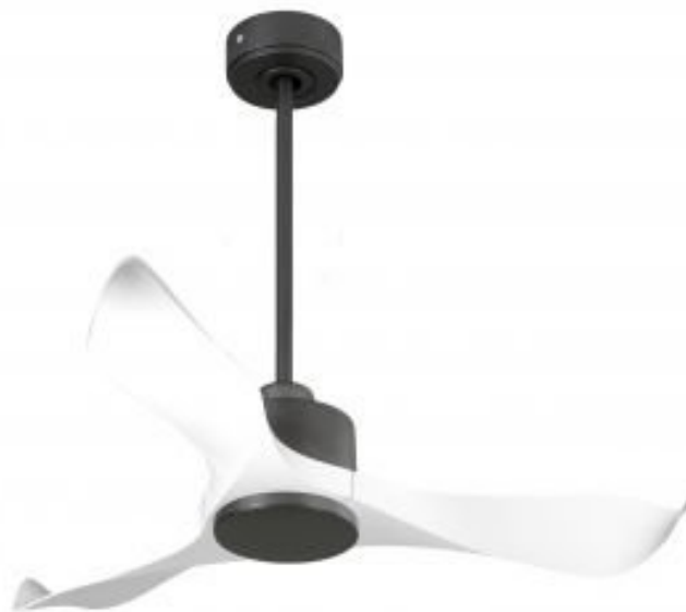
En option tige de 60 Cm Down rod 60 Cm Option

Ventilateur de plafond DC et destratificateur , ici dans sa version sans lumière pales blanches et moteur gris basalte DC hyper silence.