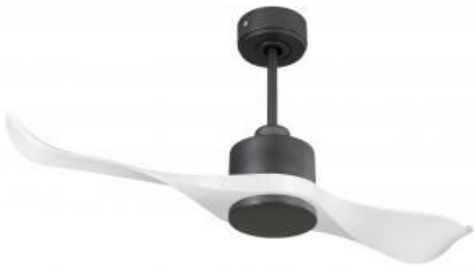
En option tje de 60 Cm Down rod 60 Cm Option