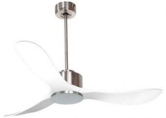
En option tije de 60 Cm Down rod 60 Cm Option