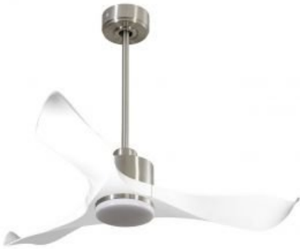
En option tije de 60 Cm Down rod 60 Cm Option.