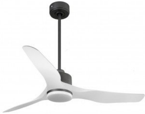
En option tije de 60 Cm Down rod 60 Cm Option