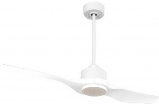
En option tije de 60 Cm Down rod 60 Cm Option