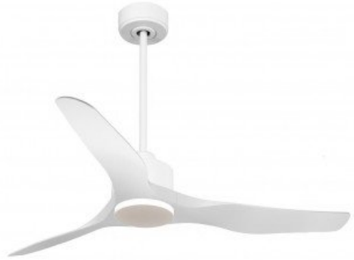
En option tije de 60 Cm Down rod 60 Cm Option