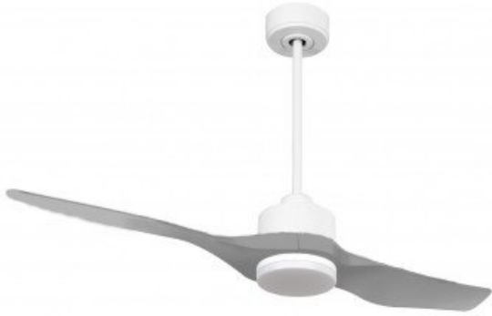
En option tije de 60 Cm Down rod 60 Cm Option