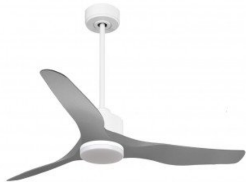
En option tije de 60 Cm Down rod 60 Cm Option