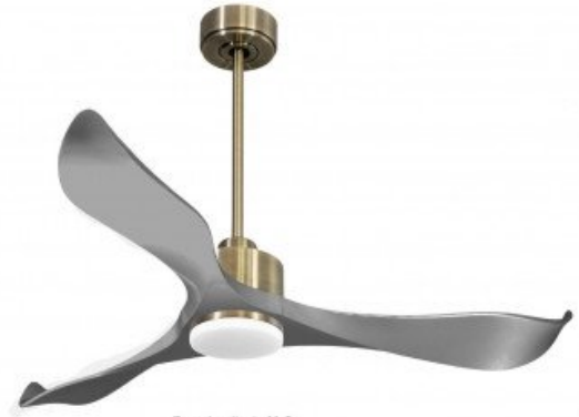
En option tije de 60 Cm Down rod 60 Cm Option