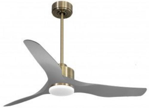
En option tije de 60 Cm Down rod 60 Cm Option