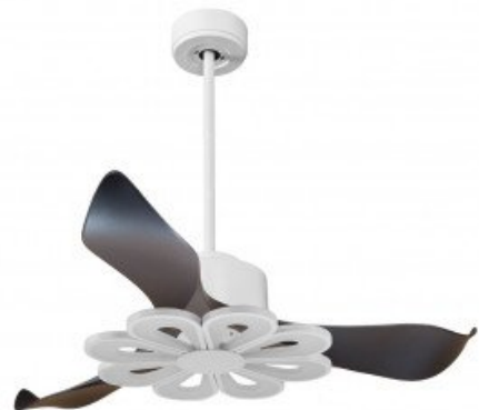
En option tije de 60 Cm Down rod 60 Cm Option