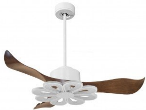
En option tije de 60 Cm Down rod 60 Cm Option