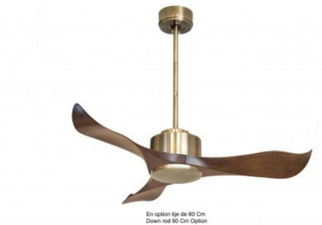
En option tije de 60 Cm Down rod 60 Cm Option