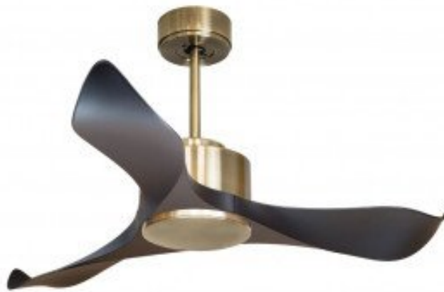
En option tije de 60 Cm Down rod 60 Cm Option

Ventilateur de plafond DC et destratificateur , ici dans sa version sans lumière pales noires et moteur couleur Laiton DC hyper silence.