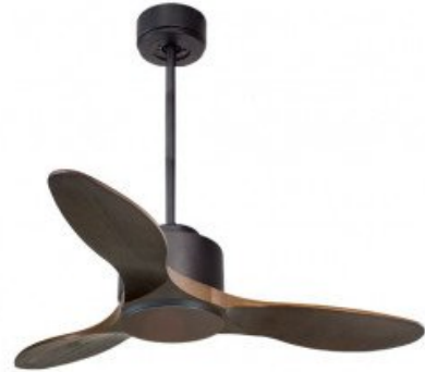
En option tige de 60 Cm Down rod 60 Cm Option