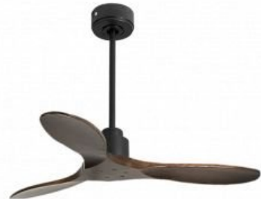
Montaje con barra de 60 cm opcional En option se de 60 Cm Down rod 60 Cm Option