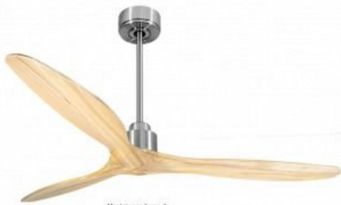
Montaje con barra de 90 cm opcional En option tipo de 60 Cm Down rod 60 Cm Option