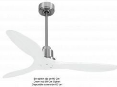
En option tige de 90 Cm Down rod 90 Cm Option Disponible également 60 cm