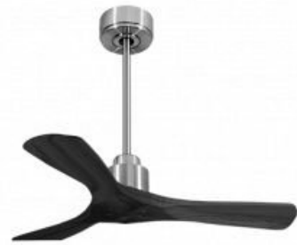
Montaje con barra de 60 cm opcional En option de 60 Cm Down rod 60 Cm Option