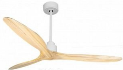
Montaje con barra de 60 cm opcional En opción de 60 Cm Down rod 60 Cm Option