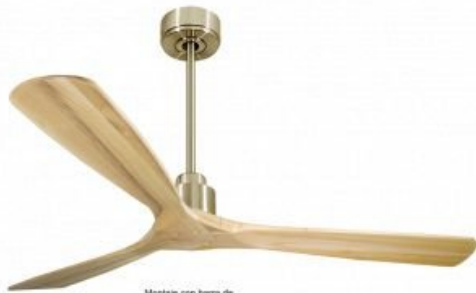
Montaje con barra de 90 cm opcional En option tipo de 60 Cm Down rod 60 Cm Option