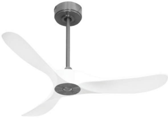
Tige de 60 Cm en option Rod 60 Cm optional