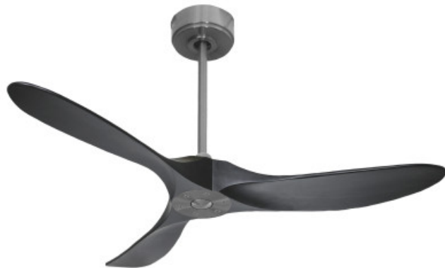
ROD 60 CM IN OPTION TIGE DE 60 CM EN OPTION