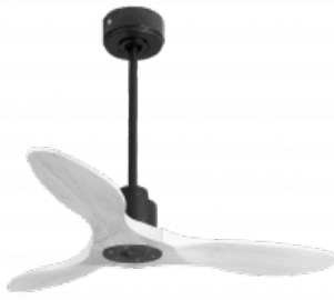
En option tije de 60 Cm Down rod 60 Cm Option Disponibile extensibile 60 cm