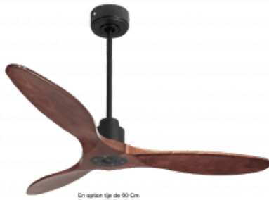
En option tije de 60 Cm Down rod 60 Cm Option Disponibile externu de 60 cm