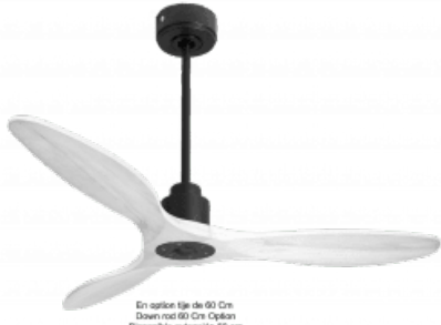
En option tige de 60 Cm Down rod 60 Cm Option Disponibile extenside 60 cm