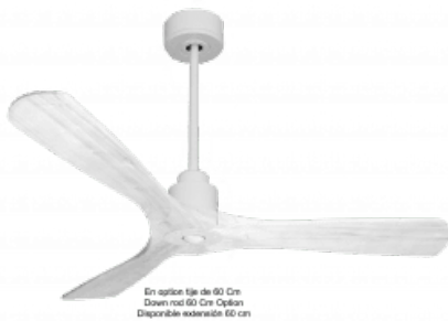
En option file de 60 Cm Down rod 60 Cm Option Disponibile eadwidth 60 cm