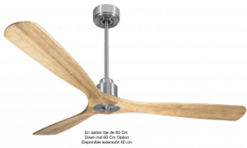
En option tige de 60 Cm Down rod 60 Cm Option Disponibile eadwidth 60 cm