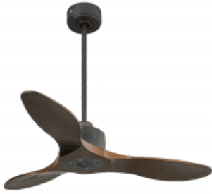
En option tige de 60 Cm Down rod 60 Cm Option Disponibile extenside 60 cm