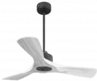
En option tije de 60 Cm Down rod 60 Cm Option Disponibile extensibile 60 cm