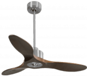
En option tige de 60 Cm Down rod 60 Cm Option Disponibile extensión 60 cm