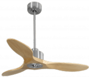
En option tige de 60 Cm Down rod 60 Cm Option Disponibile eadenside 60 cm