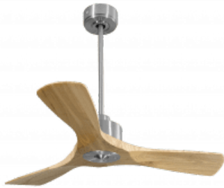
En option file de 60 Cm Down rod 60 Cm Option Disponibile extensibile 60 cm