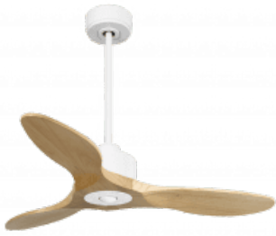
En option file de 60 Cm Down rod 60 Cm Option Disponibile extenside 60 cm