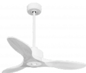
En option tige de 60 Cm Down rod 60 Cm Option Disponible également 60 cm