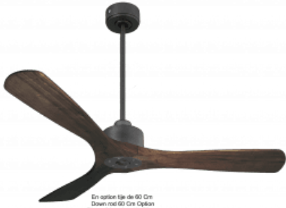
En option tije de 60 Cm Down met 60 Cm Option Disponibile exterieurde 60 cm