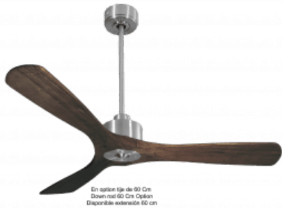
En option tige de 60 Cm Down rod 60 Cm Option Disponible extension 60 cm