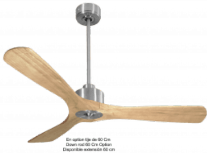
En option tige de 60 Cm Down rod 60 Cm Option Disponible extension 60 cm