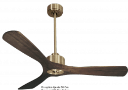
En option tige de 60 Cm Down mat 60 Cm Option Disponibile exterieur 60 cm